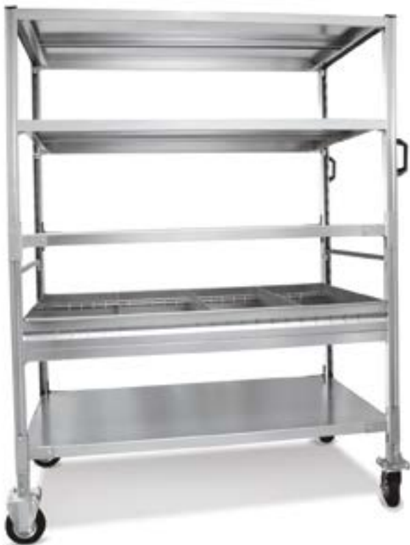
Art. S9106 con piani 1200 x 600 mm.

Realizzati con le scaffalature a gancio di pag. 218, permettono di regolare e aumentare il numero dei ripiani a piacimento.