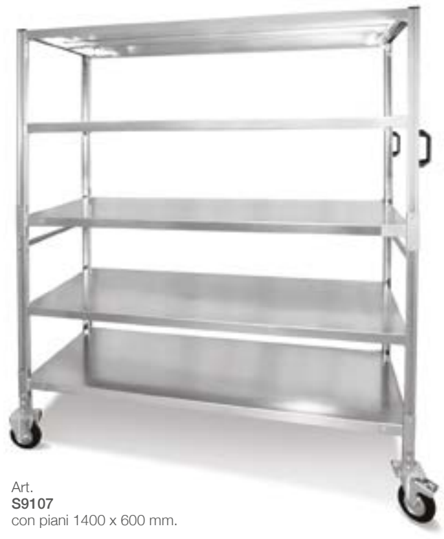
Art. S9107 con piani 1400 x 600 mm.

plus Chiedi al nostro ufficio tecnico per configurarlo secondo le tue esigenze.