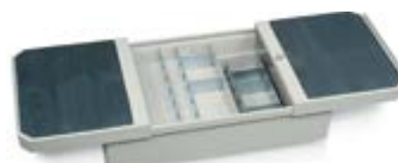
PORTA ATTREZZI SUPERIORE